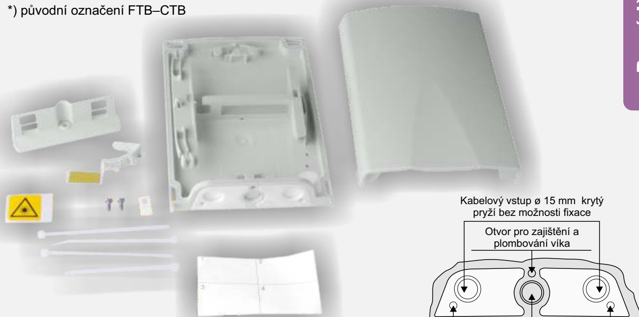
Standardní sestava rozváděče