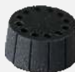
Kabelové vstupy a detail těsnícího elementu pro 12 vystupujících patchcordů