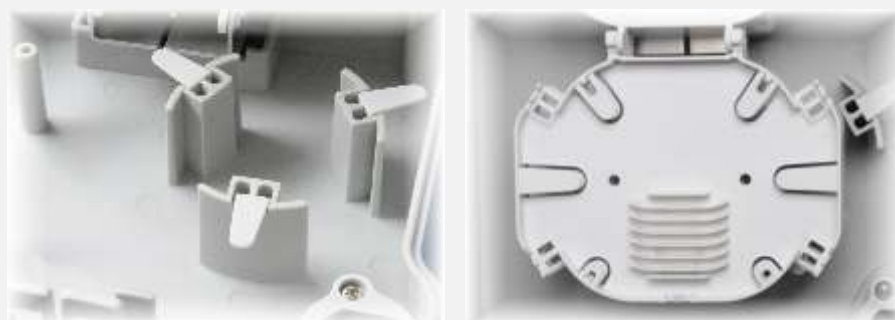
Detail kazety a organizéru rezerv